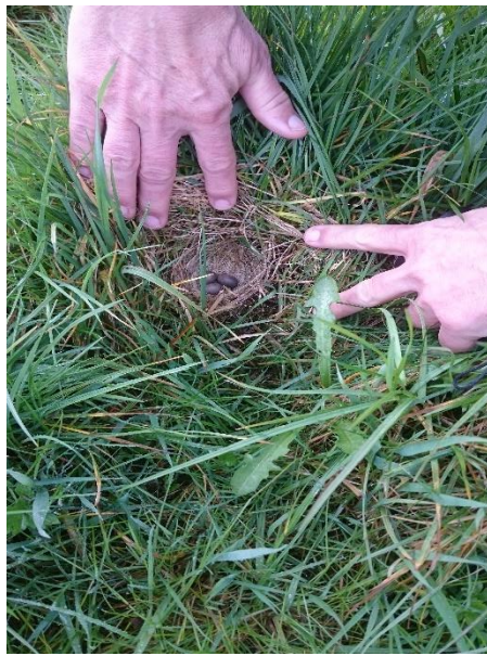
Nest met eieren van graspieper

scholeksters, kuifeenden en wintertalingen in grote groepen. Soorten als graspiepers en watersnippen troffen we het meest. Blauwborsten en rietgorzen waren duidelijk aanwezig. En natuurlijk ook de grutto's. Vergunningen waren vooraf geregeld om dwars door het gebied te kunnen lopen. Dat gaf wel een vreemd gevoel tegenover andere vogelaars die netjes op de paden bleven.