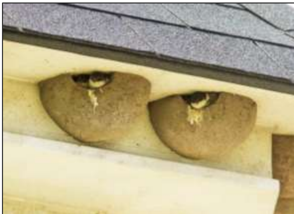
Nestkom 16 en 17, in beide kommetjes zitten jongen