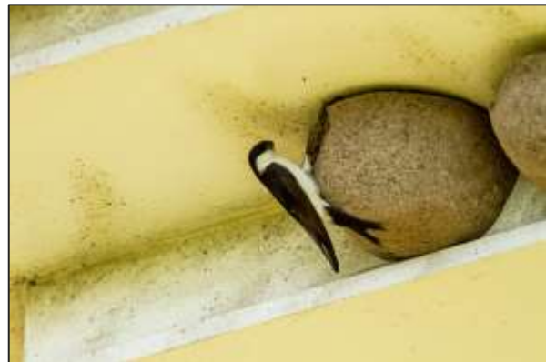
N2: regelmatig waren de jongen hier zichtbaar