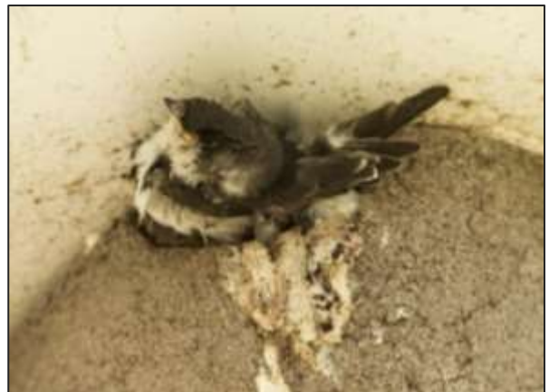
Nestkom 4: 2 dode huiszwaluwjongen in de uitvliegopening

Na het uitvliegen, was al snel duidelijk dat er een tweede broedperiode volgde. In kom 3 en 18 werden vrijwel meteen na uitvliegen weer eitjes gelegd. Daarnaast waren er broedgevallen in kom 2-21-26-28. Totaal dus 6 late of 2 o broedsels.