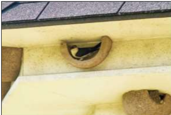
Geen code of B1 (nest nog niet af) maar wel een perfecte uitkijkpost, kommetje rechtsonder is verder dicht gemetseld