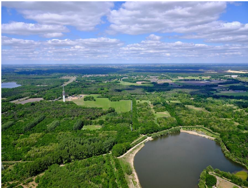
Noorderbos met Noorderplas

Het gaat in 2022 in het Noorderbos om veertig broedvogels. Er wordt op het broedgedrag van de vogels gelet. Het aantal vastgestelde territoria van veertig vogelsoorten in 2022 is vijf lager dan het aantal van het voorgaande jaar. Het ligt ook onder het gemiddelde (42,6) van de tellingen sinds 2003.