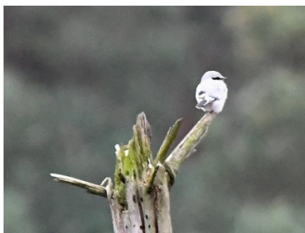
Het enige exemplaar in de Loonse en Drunense duinen?

In december is door onze werkgroep een simultaantelling gedaan in de Loonse en Drunense duinen. In 4 groepen/gebieden verdeeld, is er door 9 leden uitgekeken naar de klapekster. En hoewel de vogel buiten het broedseizoen vrij gemakkelijk is waar te nemen, door zijn lichte kleur en de gewoonte om vanuit de