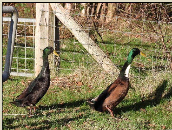
Een paar Indische loopeenden in de Dongevallei.

Sinds het midden van de zomer van 2023 zie ik regelmatig een paartje flesseneenden in de Dongevallei. Het is een opvallend beeld als ze in een kaarsrechte houding met uitgestrekte hals naar het water lopen als ze me zien. Ze kunnen niet vliegen. Met hun ronde romp en lange hals lijken het wel lopende flessen. De loopeend wordt ook Indische loopeend genoemd. Het is een ras dat in Indonesië is gedomesticeerd uit de wilde eend. Ze werden vooral op Java, Lombok en Bali gehoed in droge rijstvelden. Hun eierproductie is erg hoog, soms zelfs meer dan 150 tot 200 eieren per jaar. Het is een zeer oud ras dat meer dan 2000 jaar geleden al bestond. Er zijn veel kleurslagen van deze loopeend. Het is geen wilde vogel maar wel een cultuurhistorisch monument uit het verleden. Ze redden het hier wel even. Ze zijn zeer alert, maar dat is de vos ook!